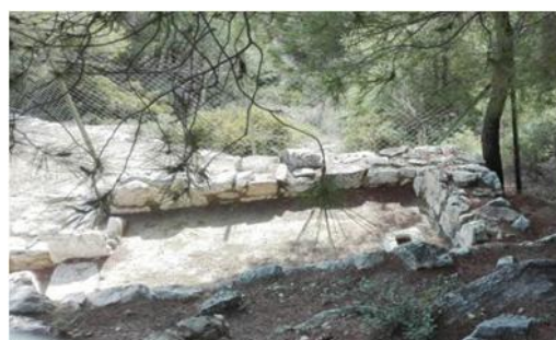
Ιερό του Διονύσου