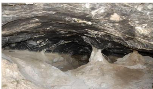
Το σπήλαιο του Ευριπίδη

Το ιερό του Διονύσου άκμασε κατά τους Ελληνιστικούς Χρόνους, τον 3ο και το 2ο αιώνα π.Χ. Τα ανασκαφικά ευρήματα του καθηγητή Προϊστορικής Αρχαιολογίας Γιάννου Λώλου τεκμηριώνουν το διονυσιακό χαρακτήρα του ιερού και τη λατρεία του Ευριπίδη ταυτόχρονα με εκείνη του Διονύσου. Μετά την καταστροφή του ιερού η συλλατρεία Διονύσου και Ευριπίδη ασκήθηκε εντατικά στο σπήλαιο του Ευριπίδη. Το σπήλαιο του Ευριπίδη, κοντά στο ιερό του Διονύσου, εξερευνήθηκε από τον Γιάννο Λώλο κατά τα έτη 1994-1997. Έχει συνολικά δέκα θαλάμους. Η χρήση του σπηλαιού χρονολογείται τόσο στους Προϊστορικούς όσο και στους Ιστορικούς Χρόνους. Στα ευρήματα συγκαταλέγονται, μεταξύ άλλων, θραύσματα αγγείων και λίθινα εργαλεία Νεολιθικής Περιόδου, χάλκινο ξίφος και αγγεία Μυκηναϊκών Χρόνων, αγγεία Κλασικών Χρόνων, νομίσματα και κεραμική της Ρωμαϊκής Περιόδου, νομίσματα και κοσμήματα της Φραγκοκρατίας. Η ανακάλυψη εν μέρει σωζόμενου σκύφου (χρονολογείται στη δεκαετία 430-420 π.Χ.) με το όνομα του Ευριπίδη χαραγμένο στην εξωτερική πλευρά του επιτρέπει την ασφαλή ταύτιση του σπηλαιού με το χώρο-ησυχαστήριο όπου ο μεγάλος ποιητής αποσυρόταν για να γράψει τις τραγωδίες του. Κατά τη Ρωμαϊκή Αυτοκρατορική Περίοδο το ησυχαστήριο του Ευριπίδη αναδείχθηκε σε αξιοθέατο και προσκύνημα (λατρευτικό άντρο).